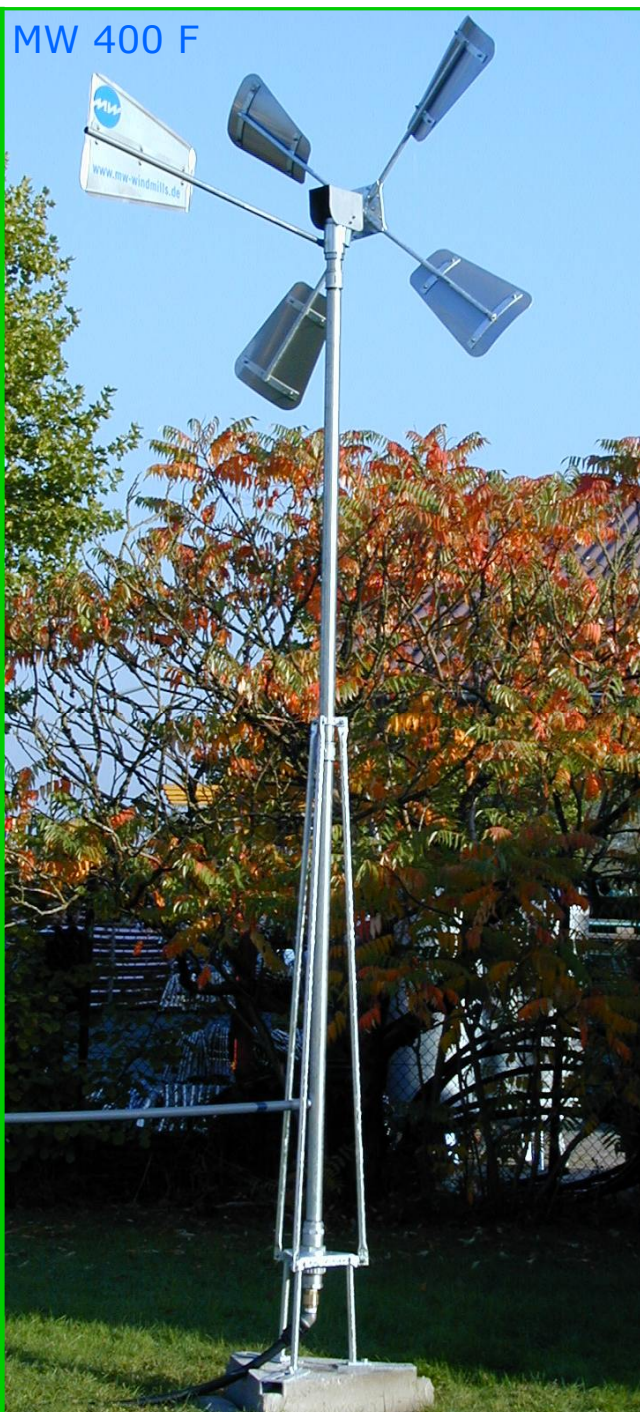
MW 400 F