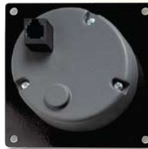
Ansicht von hinten